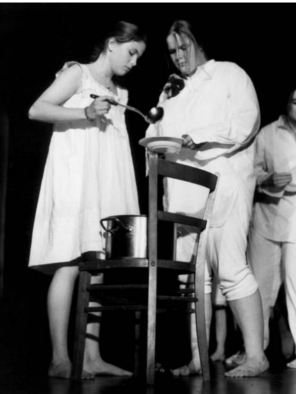
Der „Abend der Landschaften“ am 7. Oktober 1998 im Vortragssaal des Restaurants „Leineschloss“ im Niedersächsischen Landtag bot Gelegenheit, den zahlreichen Gästen einen Eindruck von der vielfältigen Arbeit des Theaterpädagogischen Zentrums der Emsländischen Landschaft zu vermitteln. Es stellten sich an diesem Abend zwei Kinder- und Jugendgruppen mit geradezu kontrastierenden Auftritten vor: Nach den temperamentvoll von der Tanzgruppe dargebotenen „Südamerikanischen Tänzen“ überzeugte die anlässlich der 350-Jahrfeier des Westfälischen Friedens initiierte Produktion „Krieg und Frieden in Europa“ unter der Regie von Jörg Meyer

Verstärkt wird die Kooperation unter den Mitgliedern der Arbeitsgemeinschaft durch gemeinsame Projekte. Genannt sei an dieser Stelle die im Zusammenhang mit der EXPO unter Federführung der Schaumburger Landschaft erfolgte jahrelange Herausgabe eines landesweiten Kulturkalenders „Regionen in Niedersachsen“.